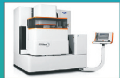
EDM Die Sinking & EDM Wire Cutting (GF)