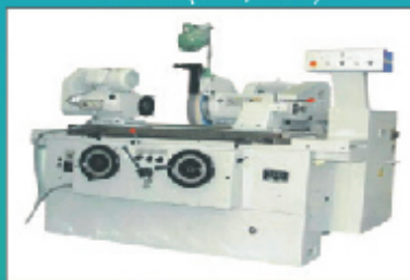
CNC Cylindrical Grinding (OMA)