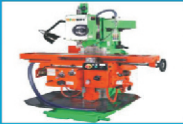
Conventional Milling (V-H-U) (BFW Make)