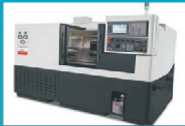
CNC Milling 3AXIS (S&T, ACE)