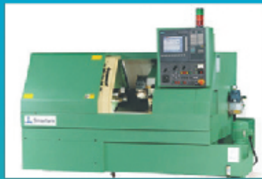
CNC Turning 3 AXIS (ACE, BFW)