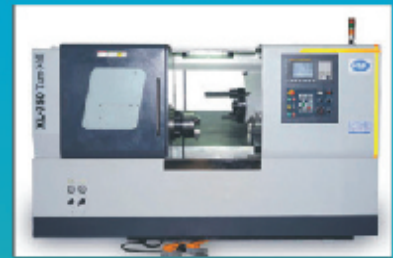
CNC Turn Mill