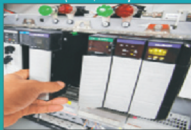
PLC & SCADA